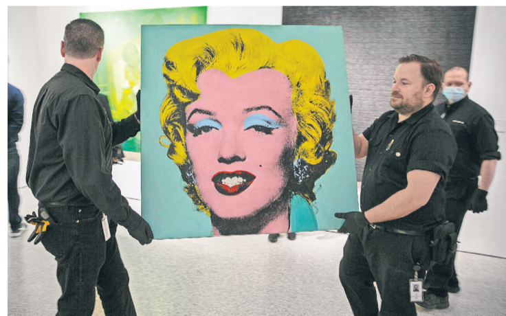
Ez a művész egyik legismertebb képe

Érdekeség, hogy ismét az MMC klubban lépnek fel, szombaton 20 órától, a Danube Music Day keretében. Ez az új koncertsorozat olyan előadókat mutat be, akik meghatározták egy-egy műfaj fejlődését, de vagy nem jártak még nálunk, vagy rég láttuk őket.