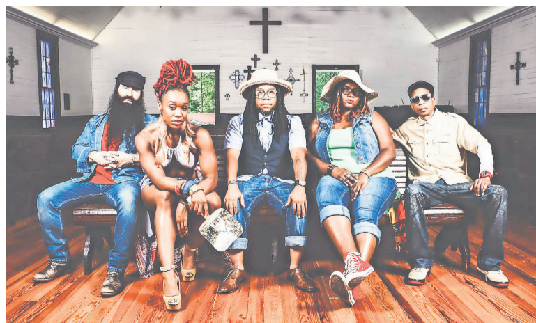
Az Arrested Developmentnek még van mondanivalója